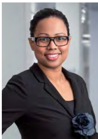
Alice Bah Kuhnke, generaldirektör, Myndigheten för ungdoms- och civilsamhällsfrågor